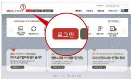
① 개인뱅킹 로그인