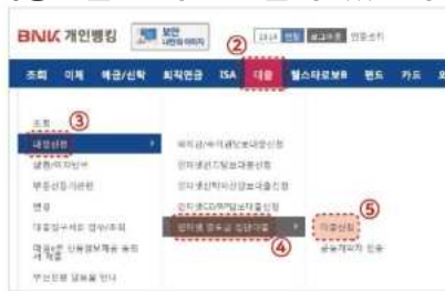
②대출 ③대출신청 ④인터넷 중도금 집단대출 ⑤대출신청